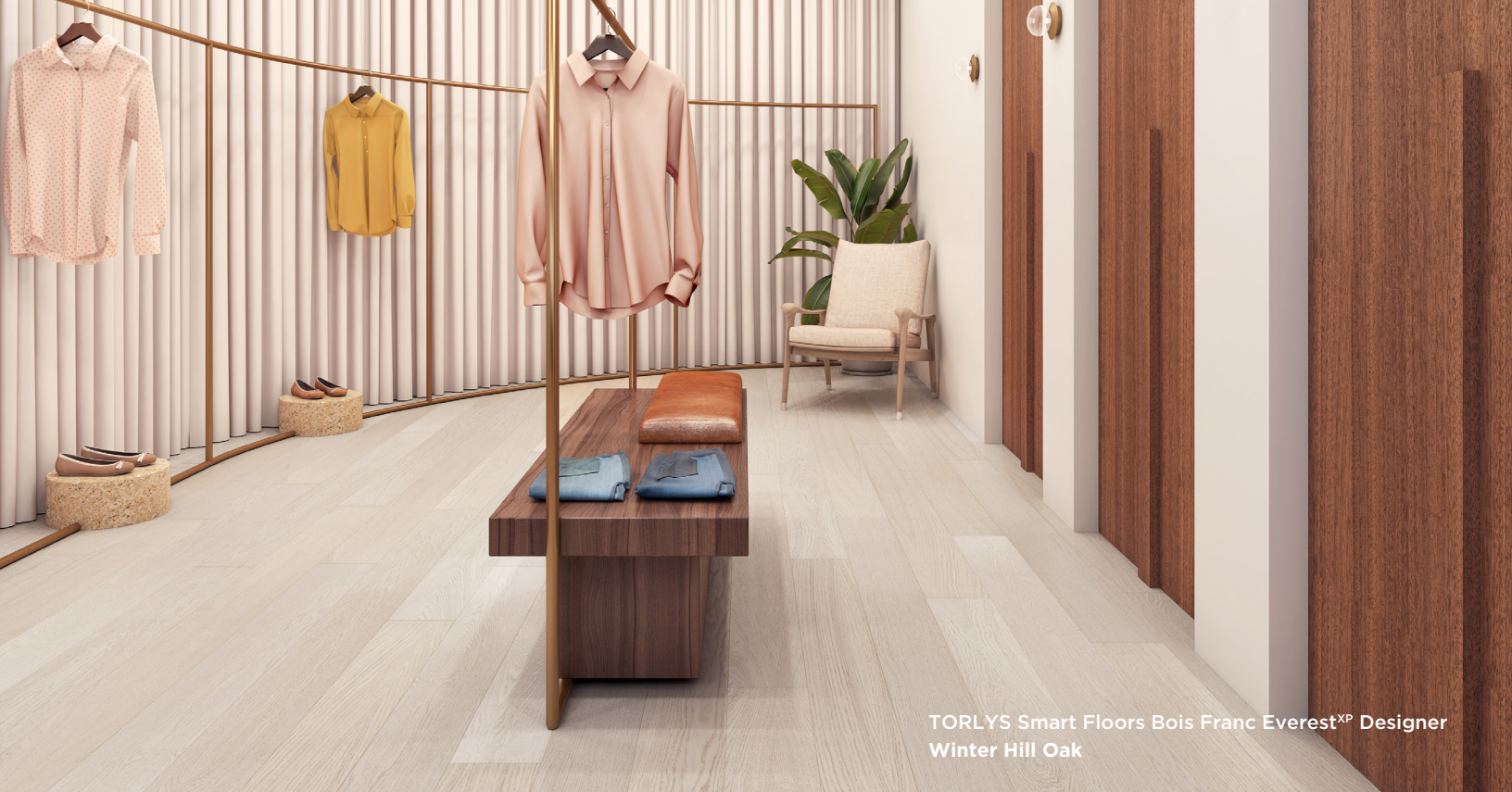
TORLYS Smart Floors Bois Franc Everest XP Designer Winter Hill Oak