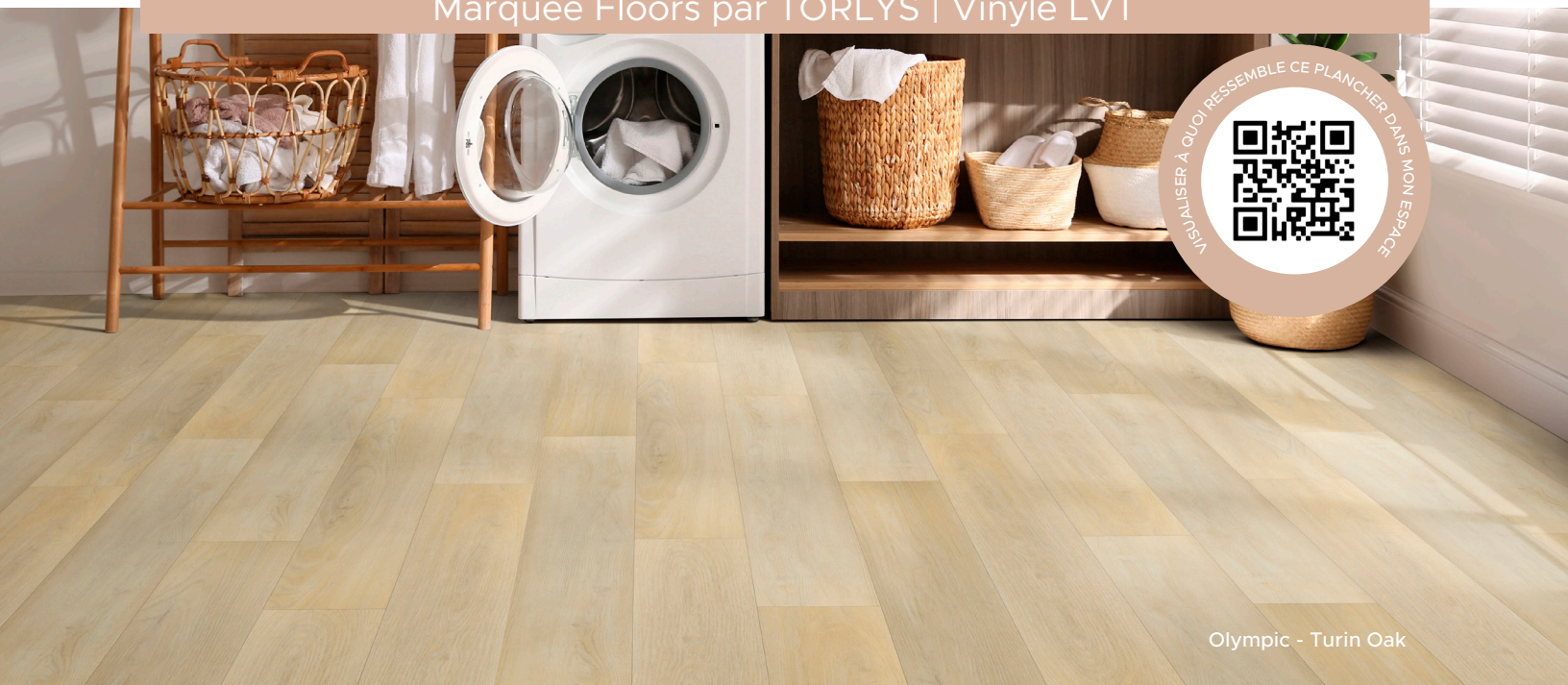
Olympic - Turin Oak